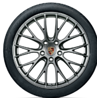
20-Zoll RS Spyder Design Rad

Erhältlich für alle 911 Carrera und 911 Carrera S Modelle (Typ 991 II). In anderen Abmessungen erhältlich für 911 Carrera 4 und 911 Carrera 4S Modelle (Typ 991 II). Erhältlich auch in Schwarz (hochglanz) und Platinum (seidenglanz).