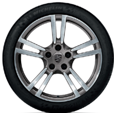
20-Zoll 911 Turbo II Rad

Erhältlich für alle 911 Carrera und 911 Carrera S Modelle (Typ 991 II). In anderen Abmessungen erhältlich für 911 Carrera 4 und 911 Carrera 4S Modelle (Typ 991 II).