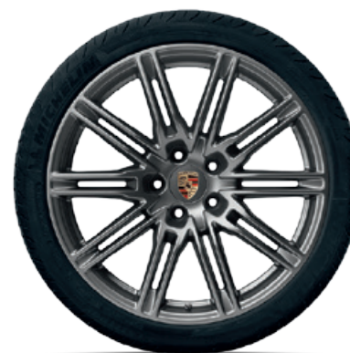
21-Zoll Cayenne SportEdition Rad lackiert in Platinum (seidenglanz)

VA: 10 J x 21 ET 50 HA: 10 J x 21 ET 50 VA: 295/35 R 21 (107Y) XL HA: 295/35 R 21 (107Y) XL