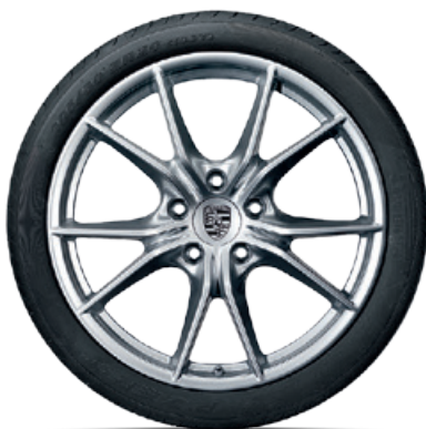
20-Zoll Carrera S Rad

Erhältlich für alle 911 Carrera und 911 Carrera S Modelle (Typ 991 II). In anderen Abmessungen erhältlich für 911 Carrera 4 und 911 Carrera 4S Modelle (Typ 991 II).