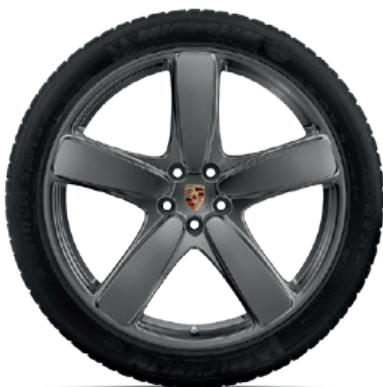
19-Zoll Sport Classic Rad lackiert in Platinum (seidenglanz)

VA: 8 J x 19 ET 21 HA: 9 J x 19 ET 21 VA: 235/55 R 19 (101Y) HA: 255/50 R 19 (103Y)