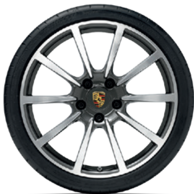
20-Zoll Carrera Classic Rad

VA: 8 J x 20 ET 57 HA: 9,5 J x 20 ET 45 VA: 235/35 ZR 20 (88Y) HA: 265/35 ZR 20 (95Y)