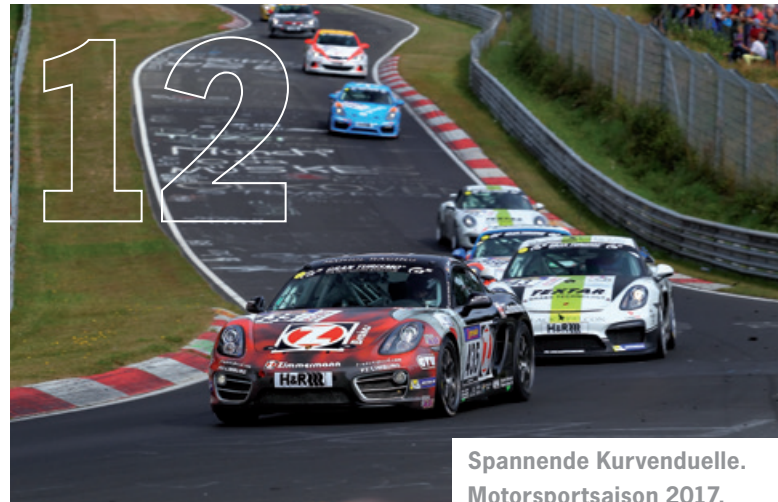
Spannende Kurvenduelle. Motorsportsaison 2017.