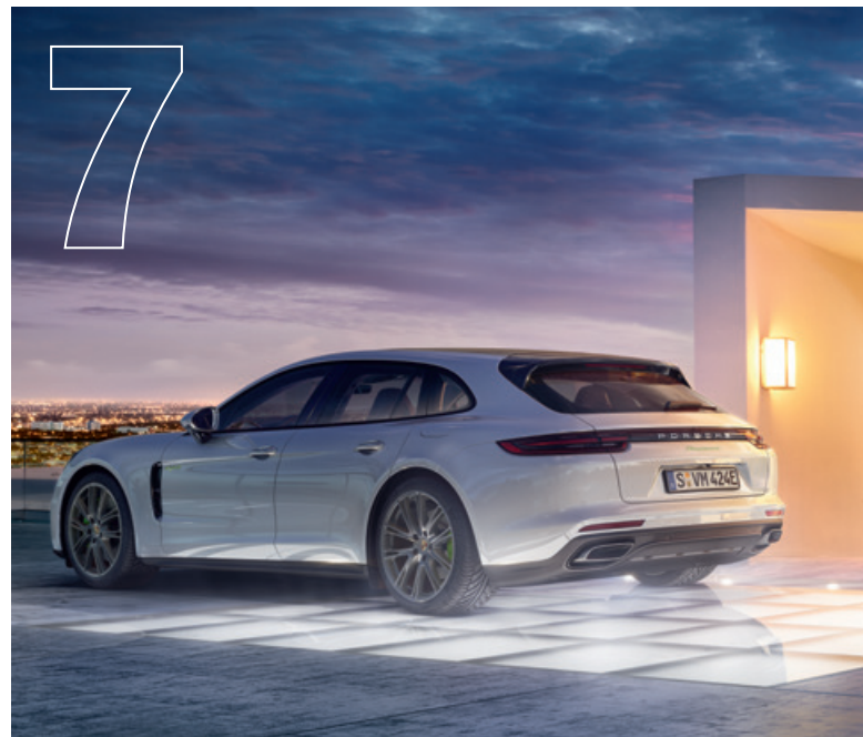
Erfahren Sie den stärksten Antrieb aller Zeiten. In der neuen Generation des Panamera.