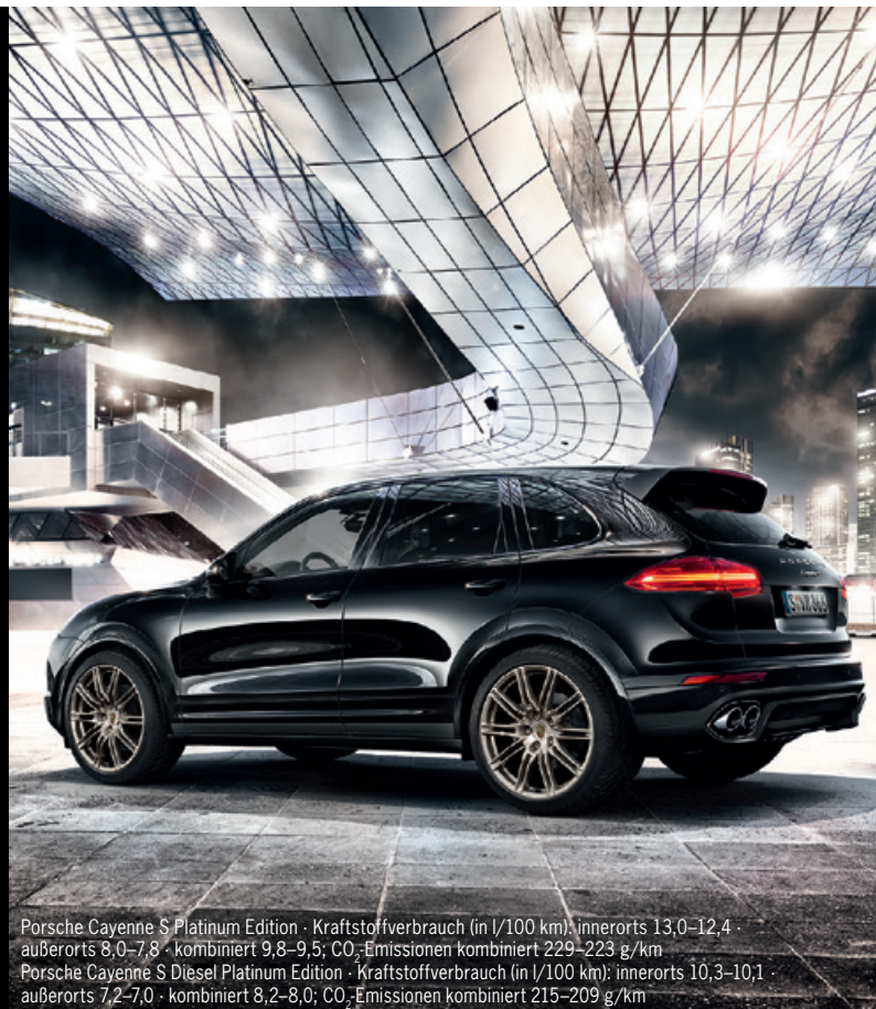
Porsche Cayenne S Platinum Edition · Kraftstoffverbrauch (in l/100 km): innerorts 13,0–12,4 · außerorts 8,0–7,8 · kombiniert 9,8–9,5; CO 2 -Emissionen kombiniert 229–223 g/km Porsche Cayenne S Diesel Platinum Edition · Kraftstoffverbrauch (in l/100 km): innerorts 10,3–10,1 · außerorts 7,2–7,0 · kombiniert 8,2–8,0; CO 2 -Emissionen kombiniert 215–209 g/km

MUT VERÄNDERT ALLES. Der neue Panamera Turbo S E-Hybrid.