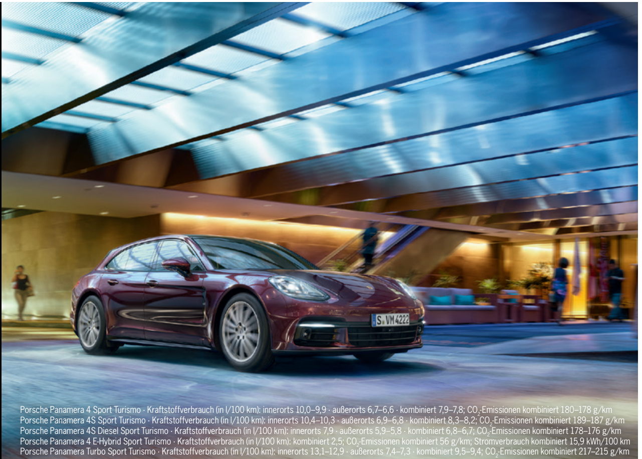
Porsche Panamera 4 Sport Turismo · Kraftstoffverbrauch (in l/100 km): innerorts 10,0–9,9 · außerorts 6,7–6,6 · kombiniert 7,9–7,8; CO 2 -Emissionen kombiniert 180–178 g/km Porsche Panamera 4S Sport Turismo · Kraftstoffverbrauch (in l/100 km): innerorts 10,4–10,3 · außerorts 6,9–6,8 · kombiniert 8,3–8,2; CO 2 -Emissionen kombiniert 189–187 g/km Porsche Panamera 4S Diesel Sport Turismo · Kraftstoffverbrauch (in l/100 km): innerorts 7,9 · außerorts 5,9–5,8 · kombiniert 6,8–6,7; CO 2 -Emissionen kombiniert 178–176 g/km Porsche Panamera 4 E-Hybrid Sport Turismo · Kraftstoffverbrauch (in l/100 km): kombiniert 2,5; CO 2 -Emissionen kombiniert 56 g/km; Stromverbrauch kombiniert 15,9 kWh/100 km Porsche Panamera Turbo Sport Turismo · Kraftstoffverbrauch (in l/100 km): innerorts 13,1–12,9 · außerorts 7,4–7,3 · kombiniert 9,5–9,4; CO 2 -Emissionen kombiniert 217–215 g/km

VERFEINERT. VEREDELT. Die neuen Cayenne S SPORTLICH VOLLENDET. Platinum Edition Modelle.