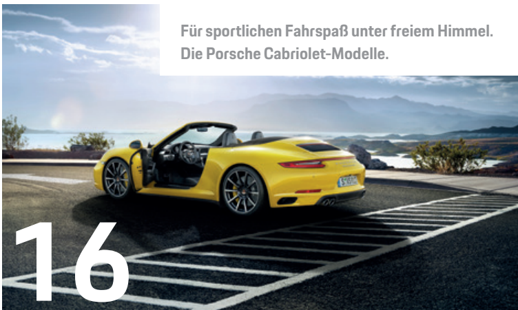
Für sportlichen Fahrspaß unter freiem Himmel. Die Porsche Cabriolet-Modelle.