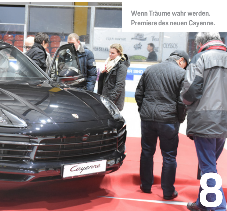
Wenn Träume wahr werden. Premiere des neuen Cayenne.