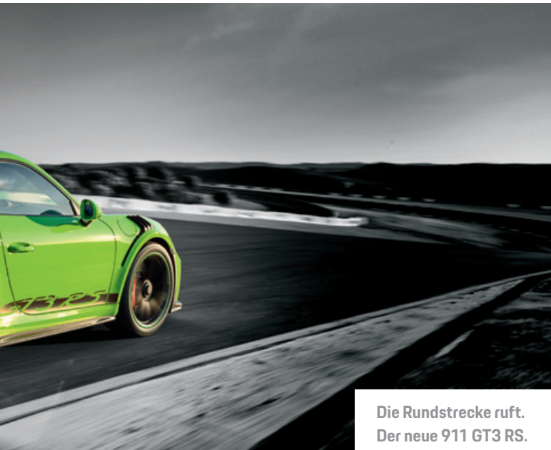
Die Rundstrecke ruft. Der neue 911 GT3 RS.