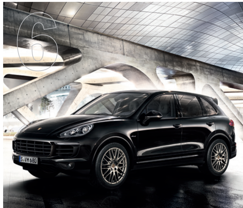
Atemberaubende Sportlichkeit in Vollendung. Die Cayenne Platinum Edition Modelle.