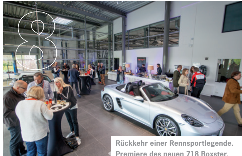
Rückkehr einer Rennsportlegende. Premiere des neuen 718 Boxster.