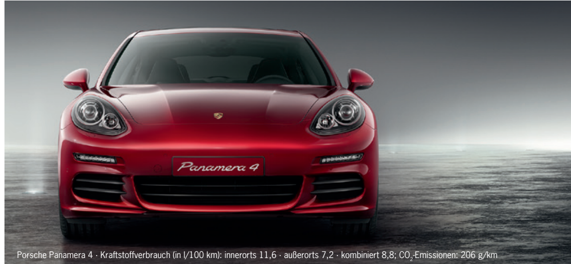
Porsche Panamera 4 · Kraftstoffverbrauch (in l/100 km): innerorts 11,6 · außerorts 7,2 · kombiniert 8,8; CO 2 -Emissionen: 206 g/km

Porsche Boxster mit PDK , 195 kW (265 PS), EZ 04/14, 18.500 km, weiß, Lederausstattung inkl. Sitze schwarz, Bi-Xenon-Scheinwerfer inkl. Porsche Dynamic Light System (PDLS), Porsche Communication Management (PCM) inkl. Navigationsmodul und universeller Audio-Schnittstelle, ParkAssistent hinten, Sportabgasanlage, 20-Zoll Carrera Classic Rad u. v. m., MwSt. ausweisbar, EUR 56.899,-