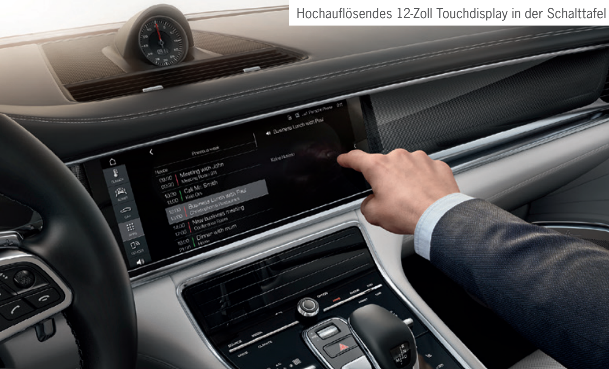
Hochauflösendes 12-Zoll Touchdisplay in der Schalltafel

Porsche Panamera 4S · Kraftstoffverbrauch (in l/100 km): innerorts 10,2–10,1 · außerorts 6,8–6,7 · kombiniert 8,2–8,1; CO 2 -Emissionen kombiniert: 186–184 g/km Porsche Panamera 4S Diesel · Kraftstoffverbrauch (in l/100 km): innerorts 7,9 · außerorts 5,9–5,8 · kombiniert 6,8–6,7; CO 2 -Emissionen kombiniert: 178–176 g/km Porsche Panamera Turbo · Kraftstoffverbrauch (in l/100 km): innerorts 12,9–12,8 · außerorts 7,3–7,2 · kombiniert 9,4–9,3; CO 2 -Emissionen kombiniert: 214–212 g/km