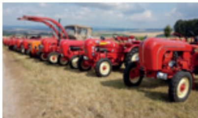
Text: Jan Holighaus, Juli 2019